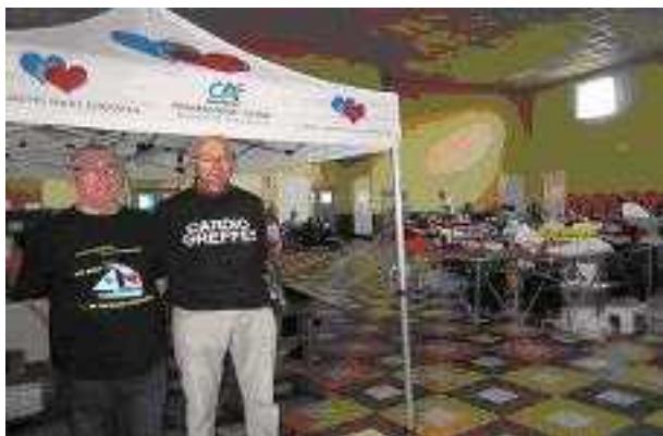
A Criquetot l'Esneval le 19 juin