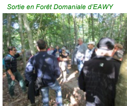
Sortie en Forêt Domaniale d'EAWY