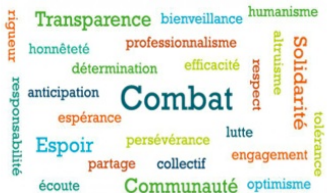
Les valeurs de « Vaincre la mucoviscidose »

L'association finance 77 projets de recherche pour 3.4 M€ tous obtenus par la générosité du public.